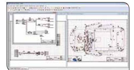
SEE Electrical Expert - Harness package