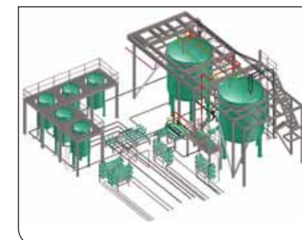
Partie d'une centrale laitière réalisée avec CADWorx Plant Professional.

Avec plus de 2 400 collaborateurs dans le monde, Intergraph Process, Power & Marine offre depuis plus de 40 ans des solutions innovantes à ses clients dans plus de 60 pays.