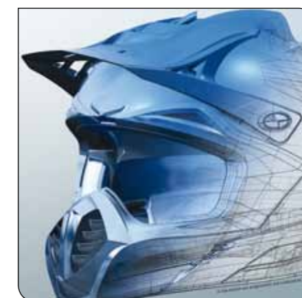
hyperCAD-S : CAO pour FAO