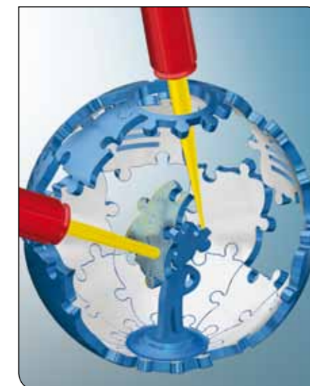
Puzzle 3D Une technologie 5 axes unique

OPEN MIND développe des solutions FAO parfaitement adaptées, comportant une part élevée d'innovations uniques pour des performances nettement optimisées dans le domaine de la programmation et de la fabrication avec enlèvement de copeaux. La volonté d'OPEN MIND de devenir le meilleur et le plus innovant des éditeurs mondiaux lui a permis de s'assurer une place dans le TOP 5 international du secteur de la FAO, selon le rapport "NC Market Analysis Report 2016" de CIMData. OPEN MIND Technologies AG est une entreprise du groupe Man and Machine qui opère dans le monde entier, notamment en Europe, Amérique et Asie, pour répondre aux exigences les plus rigoureuses en matière de fabrication d'outillages, de moules et de construction mécanique, dans l'industrie automobile et aérospatiale, ainsi que pour les technologies médicales.