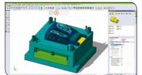
VISI CFAO, puissant modeler hybride, solide, surfacique et filaire.