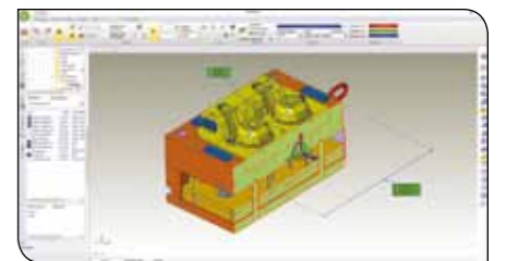
PartXplore, visualiser, analyser et collaborer rapidement