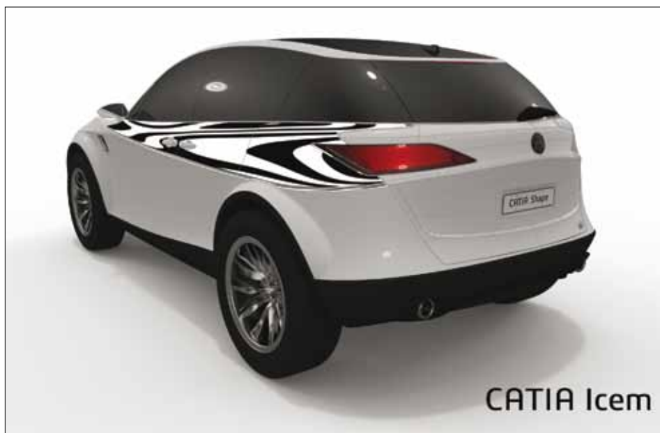
Catia Icem, ce sont les outils experts d'Icem Surf au sein de l'environnement Catia V5 et V6.

Catia Creative Design, c'est trois logiciels dans l'environnement de CAO en version V5 et V6 de l'éditeur français : Natural Sketch, Imagine &Shape et Catia Icem. Outil de sketching 3D, le premier a été lancé en novembre de l'année passée. Il est disponible aujourd'hui dans sa seconde version. Il ne s'agit pas d'un énième outil de sketching traditionnel, mais d'une solution alliant la 2D et la 3D pour couvrir la phase conceptuelle et la phase de dialogue avec l'ingénierie. En effet, l'outil combine une approche vectorielle et le dessin à main levée sur une tablette graphique, le tout dans l'environnement Catia et adapté au