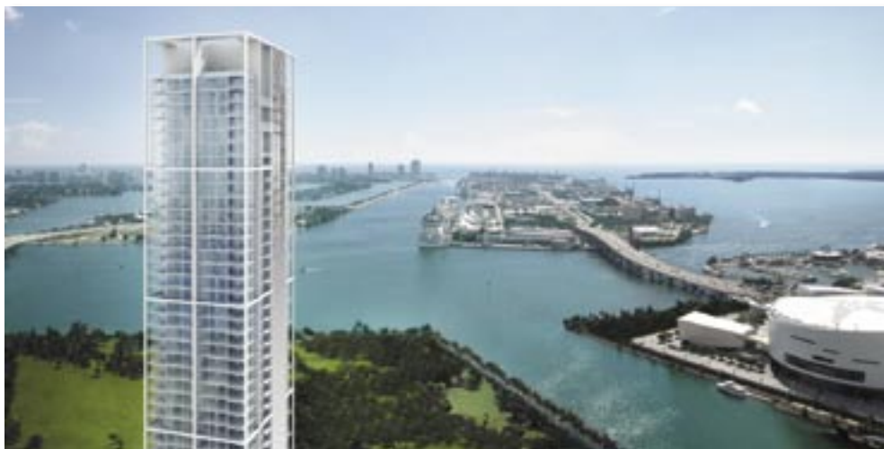
Le rendu réaliste des projets architecturaux est l'un des vecteurs du développement des outils numériques dans le secteur AEC.

L'aspect collaboratif repose sur une plate-forme intégrée (TeamWorks) capable de gérer les droits d'accès des intervenants à un même projet, le travail par zones partagées, les entrées/sorties des documents, ou encore les messages d'alertes et d'acceptations entre opérateurs lorsque les modifications effectuées par l'un impactent le travail des autres, etc. ArchiCAD gère les formats d'échange les plus communs (TIFF, JPEG,